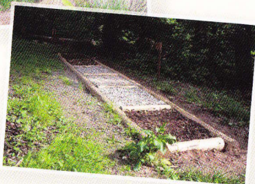
Momentaufnahmen von den zahlreichen Erlebnisstationen.

Aus Richtung Hannover? Dann hier von der B3 rechts abbiegen.